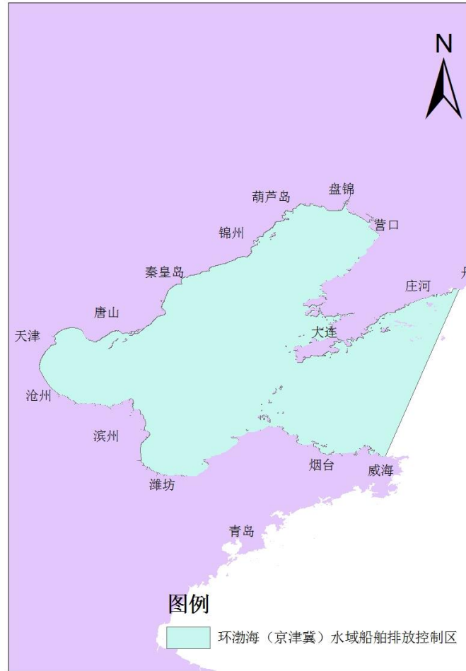
图 3 环渤海（京津冀）水域船舶排放控制区示意图